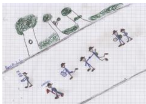
'Patrouille op tocht' door Rami Amlali