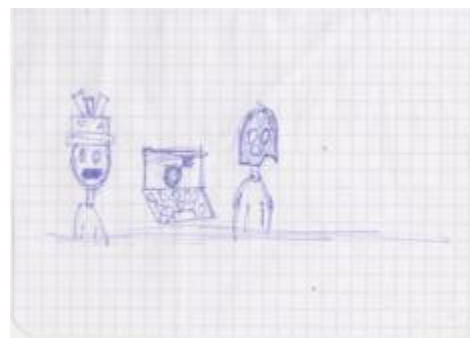
'De ontvoerders' door Victor Van Huychem

even later wordt onze rust alweer verstoord door enkele ontvoerders die Tarbagan hebben ontvoerd! De ontvoerders blijven met ons in contact door middel van filmpjes. Iedereen haalt het beste in zichzelf naar boven en samen slagen we erin Tarbagan te bevrijden. Na een spannend eindgevecht kunnen de JVG's met een veilig gevoel gaan slapen.