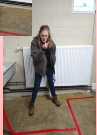
(Leidster Ree die de afbakening ontdekt)