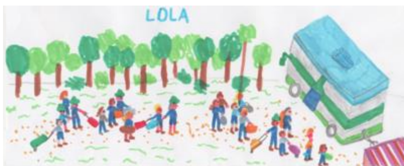
'Het vertrek' door Lola Coijns

Het was opnieuw een geweldig kamp, maar dit was nooit mogelijk geweest zonder de heerlijke maaltijden van de stam, de organisatorische talenten van de eenheidsleiding en het onuitputtelijke enthousiasme van de JVG's natuurlijk! Heel erg bedankt hiervoor en tot binnenkort!!